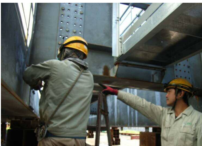
増淵班長作業中の風景